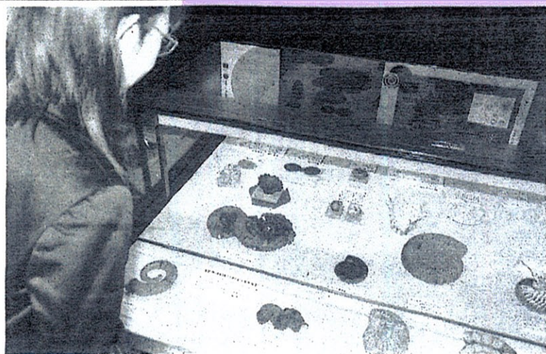
丸形や正三角形、正方形など珍しい標本が展示されている（東北大川内萩ホールで）